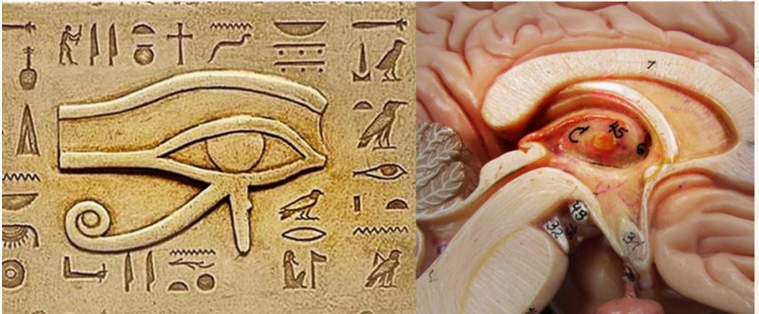
Illustration de la glande pinéale à droite et de l'oeil d'Horus, l'Oudjat.

La méditation égyptienne de l'Uraeus faite régulièrement en étant incorporée dans une routine spirituelle, permet progressivement d'ouvrir le centre du troisième oeil ou Oudjat.