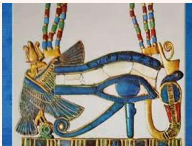
Trésor de Toutânkhamon, bijou, XVIIIe dynastie, Nouvel Empire, Égypte Ancienne.

L'uraeus symbolise donc cette énergie intérieure divine qui monte et protège Pharaon lui même de ce chaos en lui donnant la vision intérieure. Ce n'est pas pour rien que le cobra se situe au niveau du troisième oeil. Sur l'image ci dessous, on voit la déesse Nekhbet reliée au crâne de Pharaon, l'Oudjat au centre symbolisant le 3eme oeil situé au niveau de la glande pinéale et ayant d'ailleurs sa forme, puis au devant le cobra Uraeus dressé sous les traits de la déesse Ouadjet: